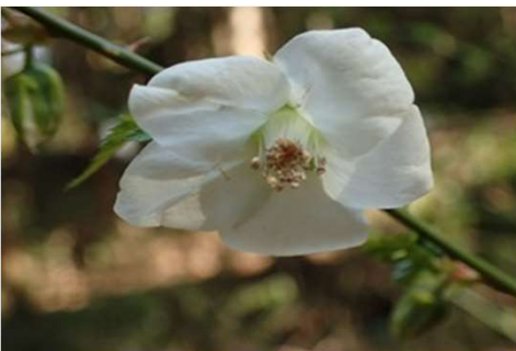
ナガバモミジイチゴ