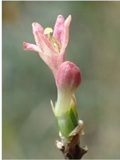
ヤマウグイスカグラ

<今日のコース予定> 駐車場～四ツ沢～物見山林道～溜池 サテライト(昼食)～海上大正池～駐車場 (天候によっては変更する事もあります。)