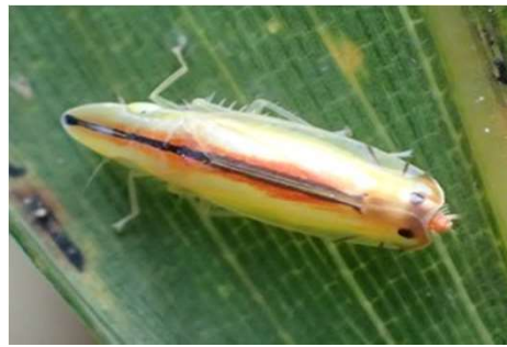
クロスジホソサジヨコバイ