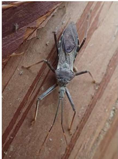
オオトビサシガメ

コロナと防寒対策を忘れずに初冬の森を満喫しましょう。今年最後の海上の森自然観察会となりました。来年もよろしく願い申し上げます。