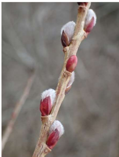
イヌコリヤナギ花芽