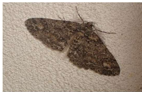
シロテンエダシャク