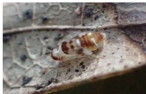
ヨツモンホソチャタテ幼虫