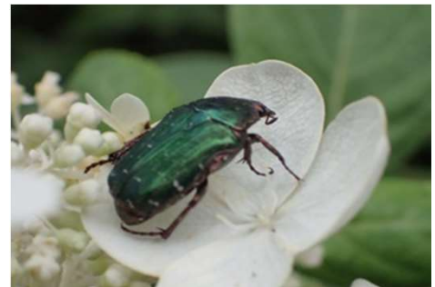
コアオハナムグリ