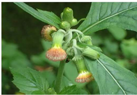
ベニバナボロギク