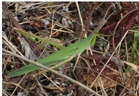
ショウリョウバッタ♀