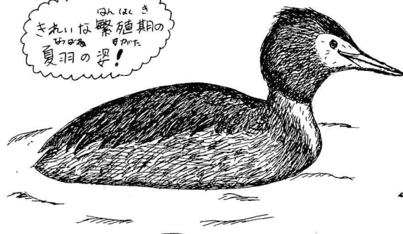
カムリカイツフリ

植田の池や、梅田川に、冬越て来る、優美なカムリカイツフリ。春の3月25日、梅田川では美しい夏羽に変った姿を見る事ができました! やがて繁殖(子育て)のためにヨーロッパに渡る時に備え結婚相手を見つけるための姿に変ったのだね。