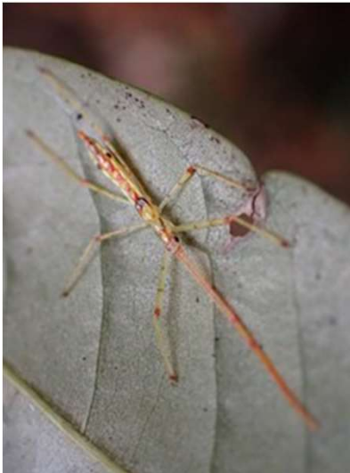
アシナガサシガメ幼虫