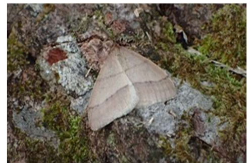
クロスジフユエダシヤクミ

<今日のコース予定> 駐車場～四ツ沢～物見山林道～物見山(昼食) ～海上大正池～サテライト～駐車場 (天候によっては変更する事もあります。)