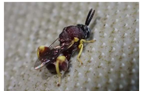
キアシブトコバチ