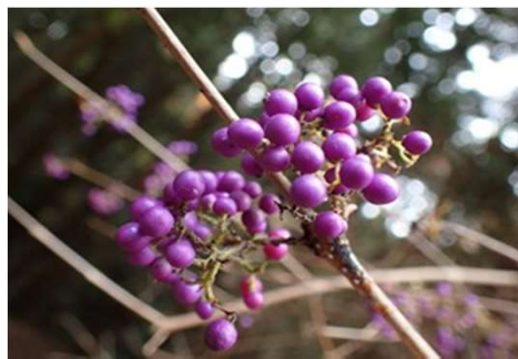
ムラサキシキブ実