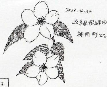
2023.4.22. 岐阜県飛騨市 神岡町で。

どこか状況は似ていて、生物層記録を見て感じます。フジ、カマツカ、スタシイが2021年と並んでの最早記録。スタシイは、かつては5月初旬の花だったのに…。ツクミの終認は、少ない数の今シーズンでも大きな変化は見られませんでした。今度の秋の頃は数が増えるといいね！平常通りの春を願います。この春、出会えずに終わってしまった各フィールドの花が多くありました。来年こそは！！