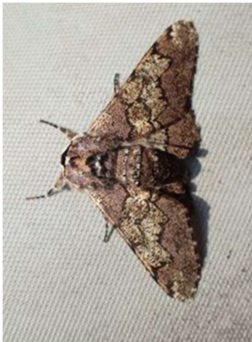
トビモンオオエダシャク