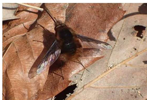
ビロードツリアブ