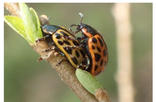
ヤナギハムシ ペア