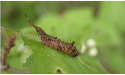
アシベニカギバ幼虫