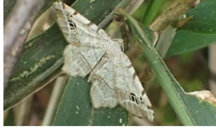
ウスキオエダシャク