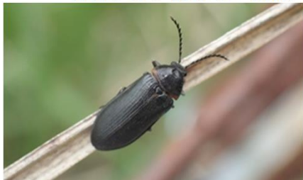
ヒゲナガハナノミ♀