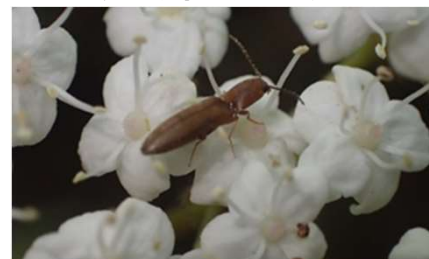
キバネホソコメツキ