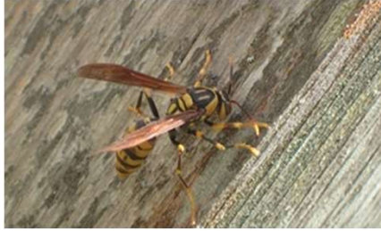
キアシアシナガバチ