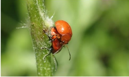
オオアカマルノミハムシ