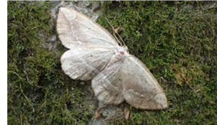
ツマキエダシャク