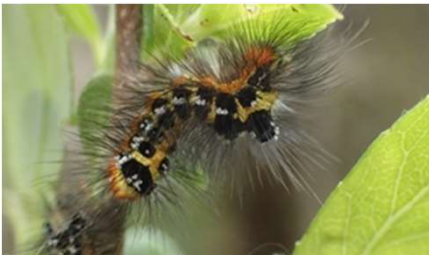
モンシロドクガ幼虫