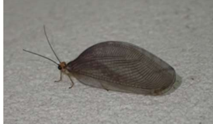
スカシヒロバカゲロウ