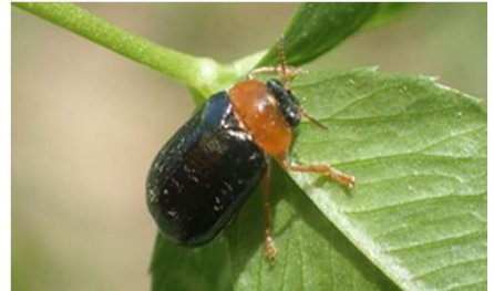
ムナキルリハムシ