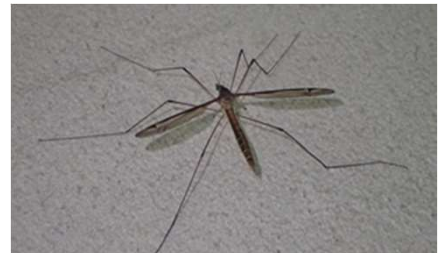
キリウジガガンボ