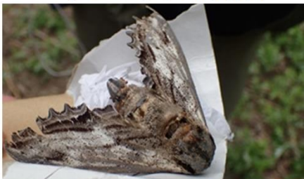
オオシオフリスズメ 死骸