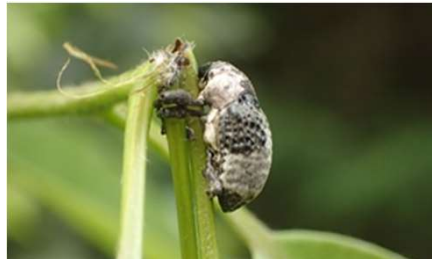
オジロアシナガゾウムシ