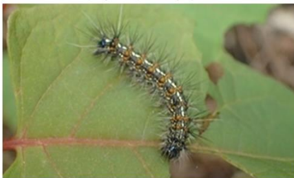
クワゴマダラヒトリ幼虫