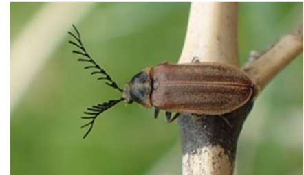
ヒゲナガハナノミ♂