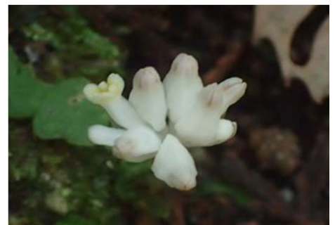
ヒナノシャクジョウ