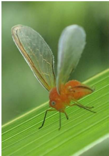
アカハネナガウンカ