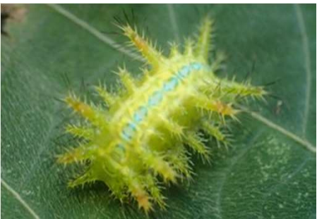
ヒロヘリアオイラガ幼虫