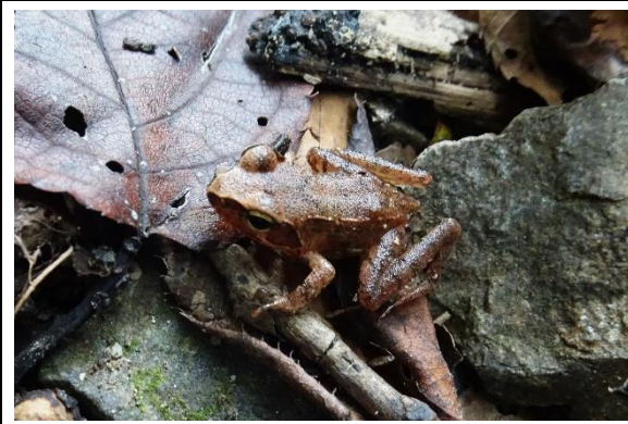
タゴガエル アカガエル科