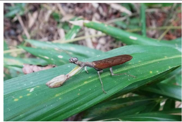
ヒメカマキリ ハナカマキリ科