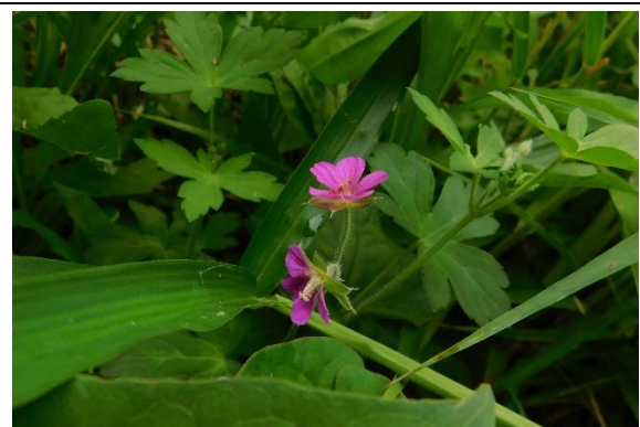
ゲンノショウコ フウロソウ科

今日も暑い一日です。天気予報では、明日低気圧と前線が南下し大気が入れ替わりそうです。初秋の生き物たち、ツクツクボウシは最後のセミの声でしょうか。バッタやトンボの観察ができ、草花の花もみられるようになりました。