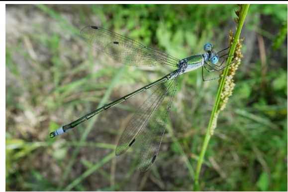
アオイトトンボ アオイトトンボ科