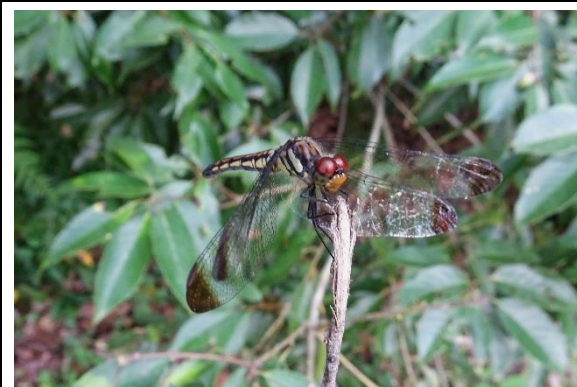
ノシメトンボ トンボ科