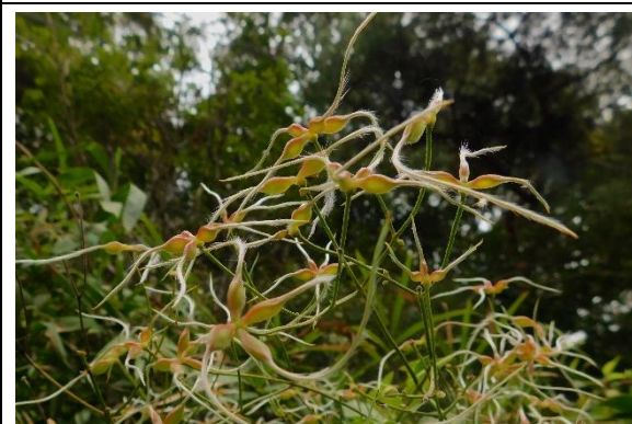
センニンソウ 実 キンボウゲ科