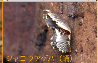
ジャコウアゲハ (蛹)