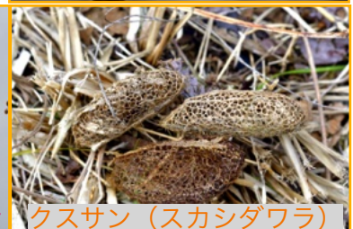
クスサン (スカシダワラ)